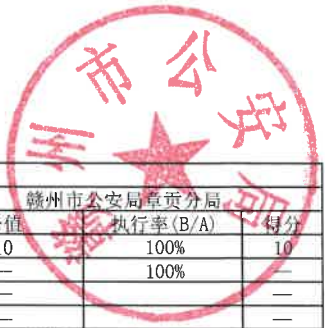
项目支出绩效自评表 (2021年度)