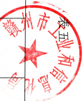
赣州市工业和信息化局2023年度行政检查实施情况统计表