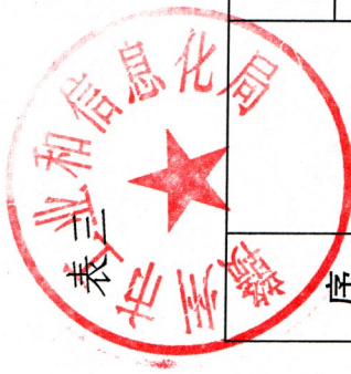
赣州市工业和信息化局2023年度行政处罚实施情况统计表