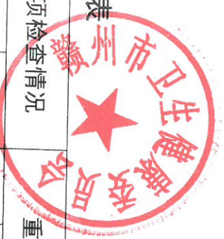
赣州市卫生健康委2023年度行政检查实施情况统计表