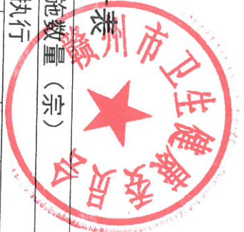
赣州市卫生健康委2023年度行政强制措施实施情况统计表