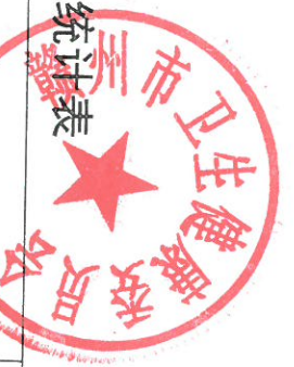
赣州市卫生健康委 2023 年度行政执法总体情况统计表