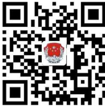
司法厅新浪官方微博二维码