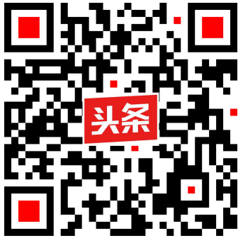
司法厅今日头条号二维码