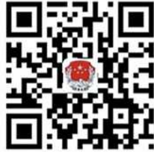
司法部新浪官方微博二维码